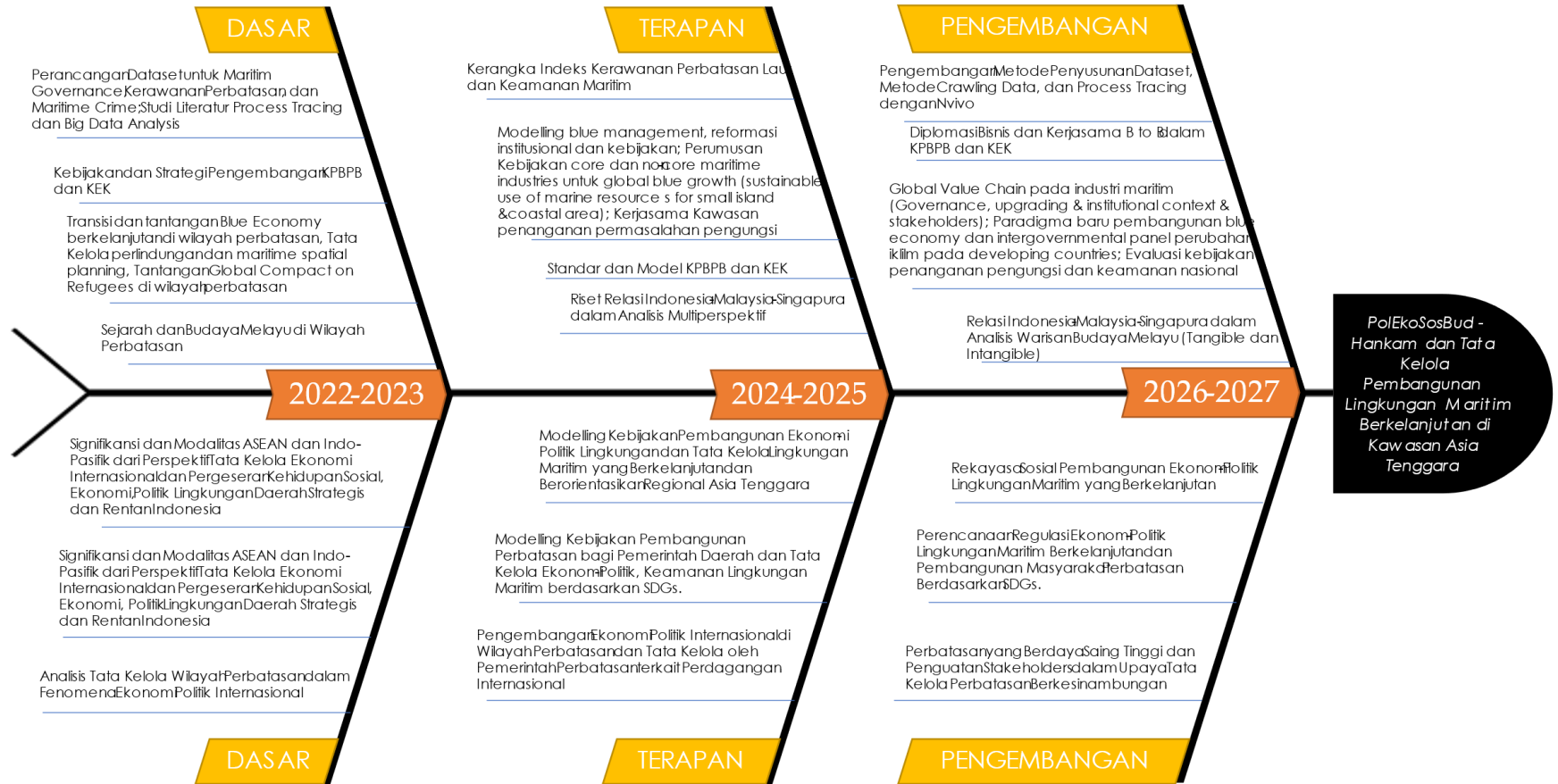
Diagram 2. 1 Rencana Induk Penelitian Jurusan Ilmu Hubungan Internasional